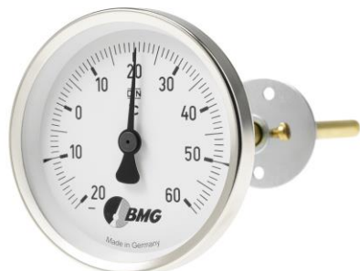
Typ 04 mit Option Stahlflansch

Genauigkeit Klasse 2 nach EN 13 190 (bisher DIN 16 203)